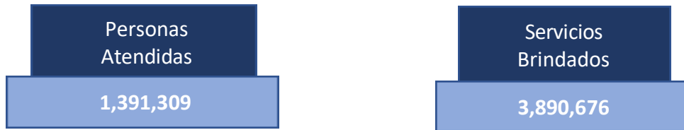
Número de usuarios atendidos en Ventanillas de Salud según tipo de servicio recibido

De acuerdo con el análisis de información que realizó la Sección mexicana de la Comisión de Salud Fronteriza México-Estados Unidos del SICRESAL-MX, de enero a diciembre 2019 se obtuvieron los siguientes resultados: